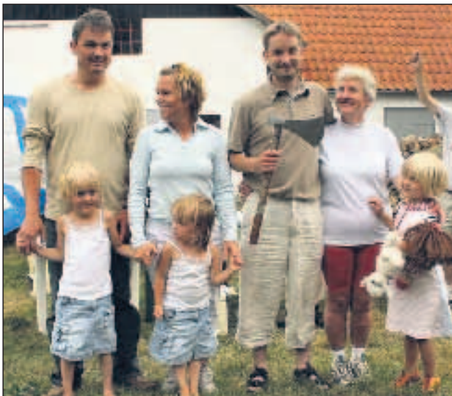
Familien Thyssen fra Horsens var bare de stærkeste til Vikingedysten. Ingen anden klub kunne stille fire seniorer som klarede sig bedre. SK.