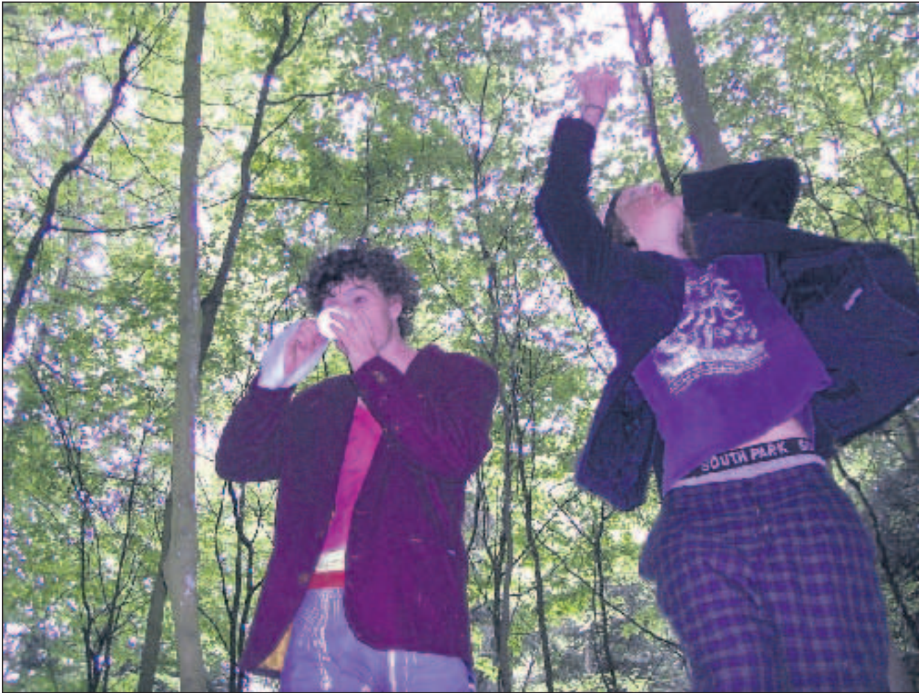
De to ungdomsreportere i en intens enmands te-stafet. Nord vandt!