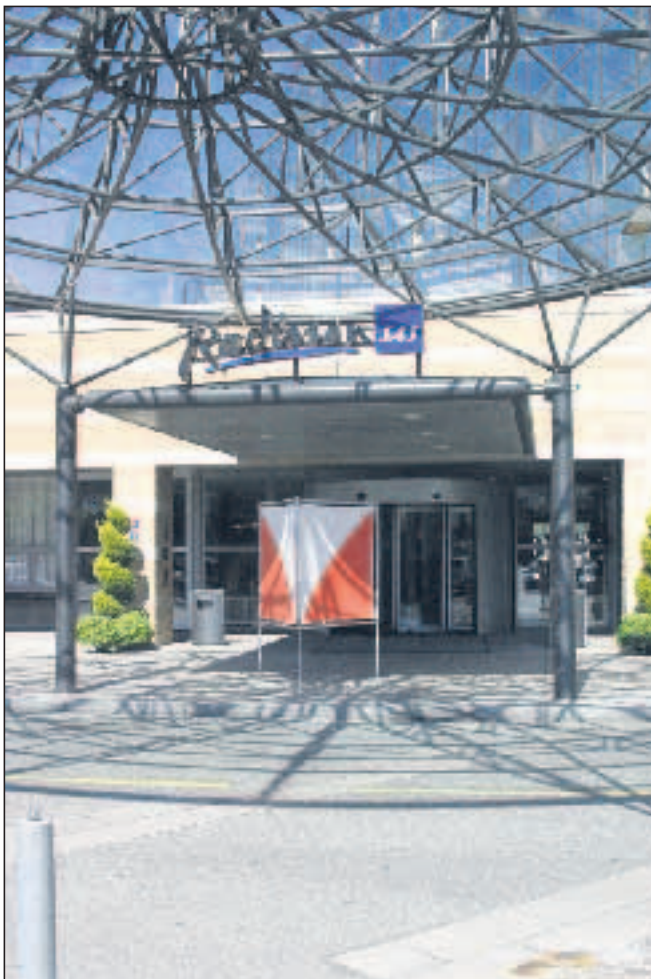
Orienteringsverdenen er parat til at indtage Århus. Her stævne- og pressecenter på SAS Radisson. PS.