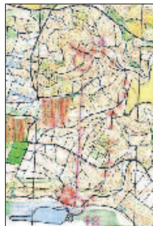
Bjergspurten var mellem post 13-14

Der var på kortet markeret, at bjergspurten var mellem post 13-14. Der var et o-kort over strækket, som viste sig at være vejvalgsbetonet og ganske krævende at gennemføre perfekt. Vi havde undervejs til bjergspurten forsøgt at slå hul til vores 'skygge' Team Fusion, men uden held. Deres taktik var ikke overraskende at hænge på os. Vi diskuterede, hvordan vi skulle komme af sted på strækket, uden at trække Team Fusion med og dermed risikere at blive slået af dem. Vi var ikke i tvivl om, at de ville vente til vi havde klip-