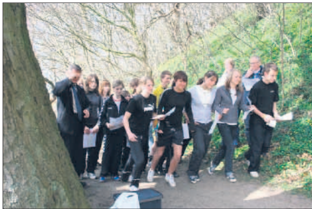
Elever fra en lokal 8. klasse var med til at løbe initiativet i gang.

der lavet fast lørdags orientering. Hertil er der udarbejdet en pakkeløsning over 4 lørdage, med 3 baner pr. lørdag. Der er altså udarbejdet 4 lørdagsarrangementer. Når de er afviklet startes der forfra (Roskilde modellen). Systemet virker meget godt. Der møder nye løbere op hver lørdag og det vokser stille og roligt. Klubben har en tovholder på, der sørger for at der er en leder og et antal hjælpere hver lørdag. Efter løbet kan der købes kaffe og brød og der er mulighed for eftersnak.