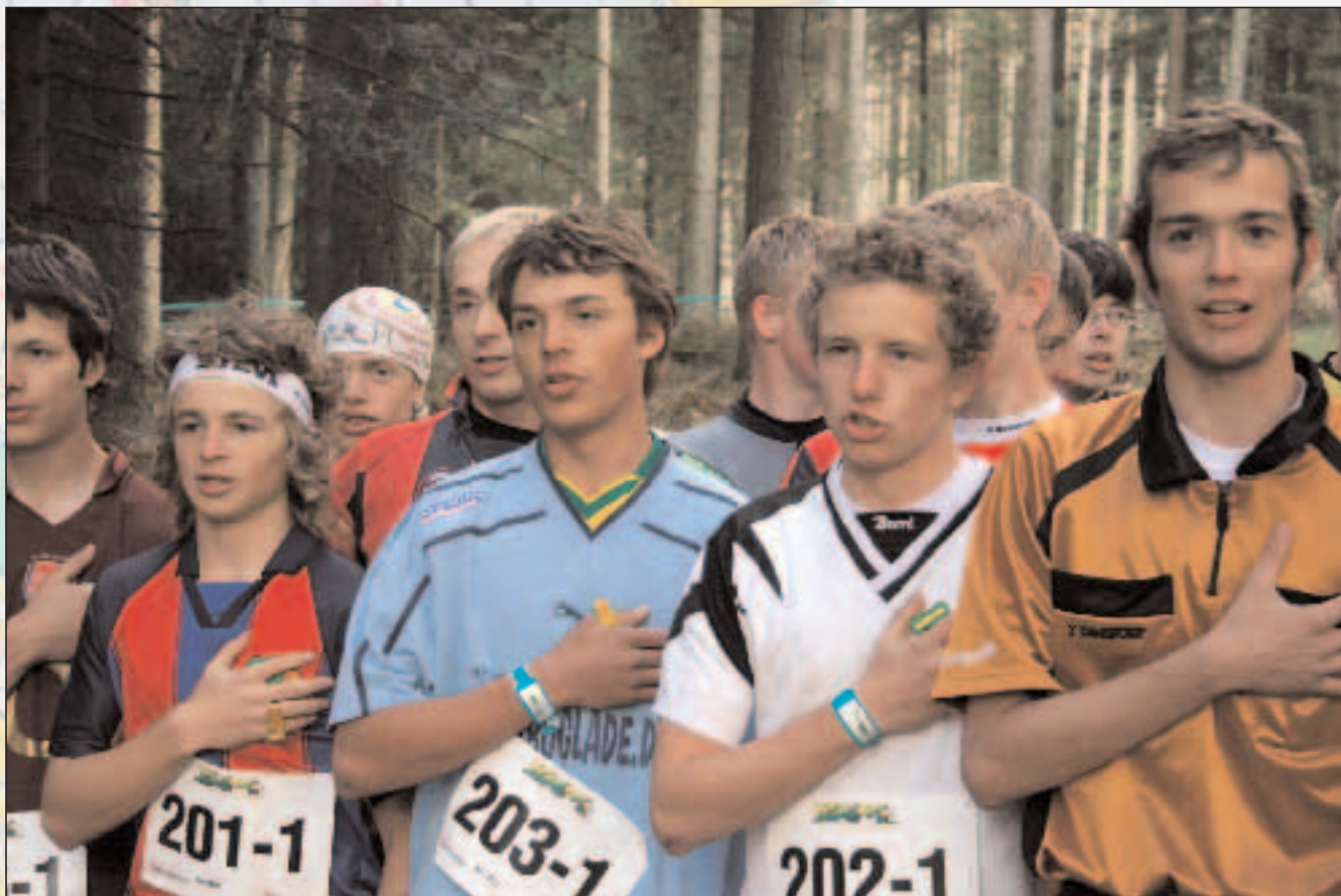
Stemningsfuld og andægtig afsyngelse af nationalsangen inden stafetten går i gang. JL

Resten af aftenen og noget af natten med, festede løbere i alle aldre sammen. Der var gang i den på dansegulvet og alle