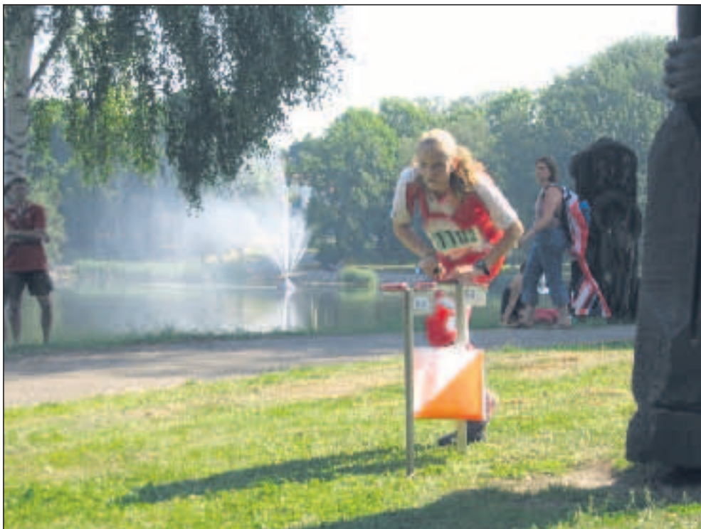
Signe ved publikumsposten. TBH