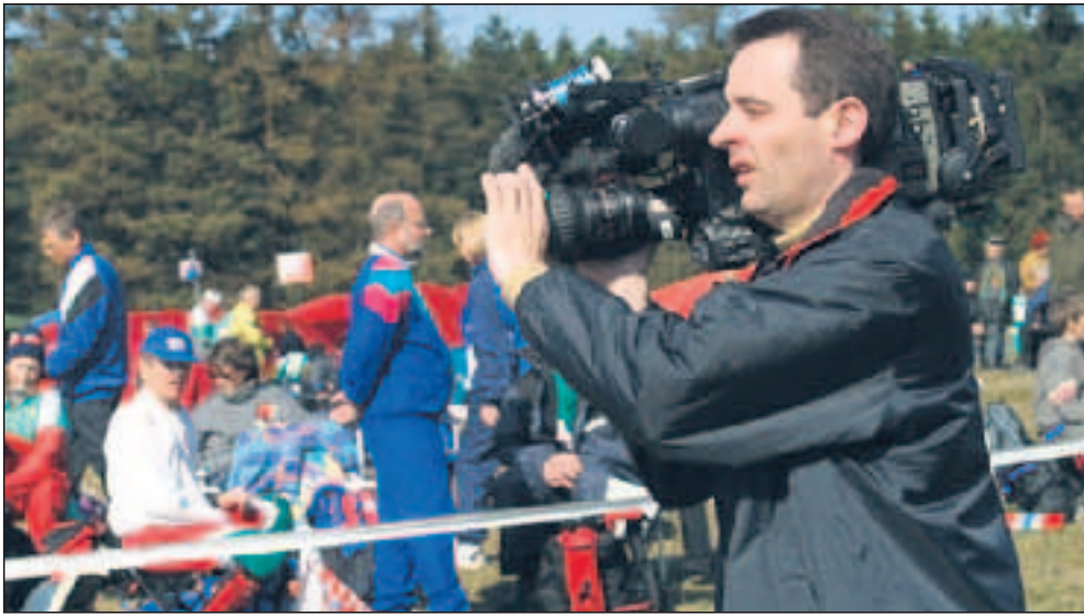
TV-folkene får travlt ved VM-stævnet i Danmark.

- Det lader sig sagtens gøre at lave spændende tv fra oriente-