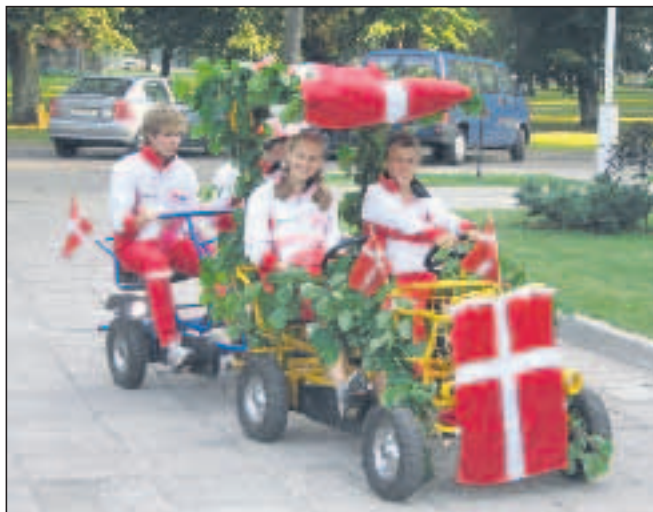
Sejlskareten vakte berettiget opsigt. TBH