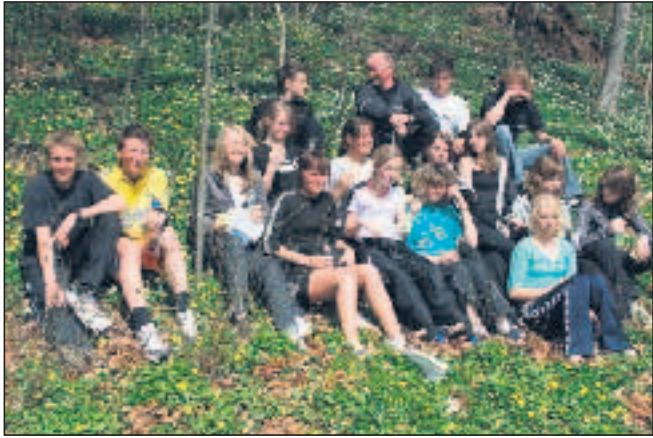
Mange nye unge O-løbere - er et af målene i Skive.