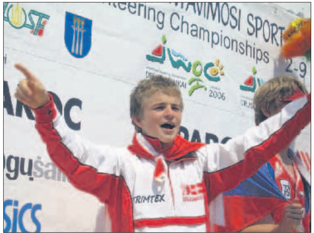
En glad og stolt juniorverdensmester på podiet. TBH