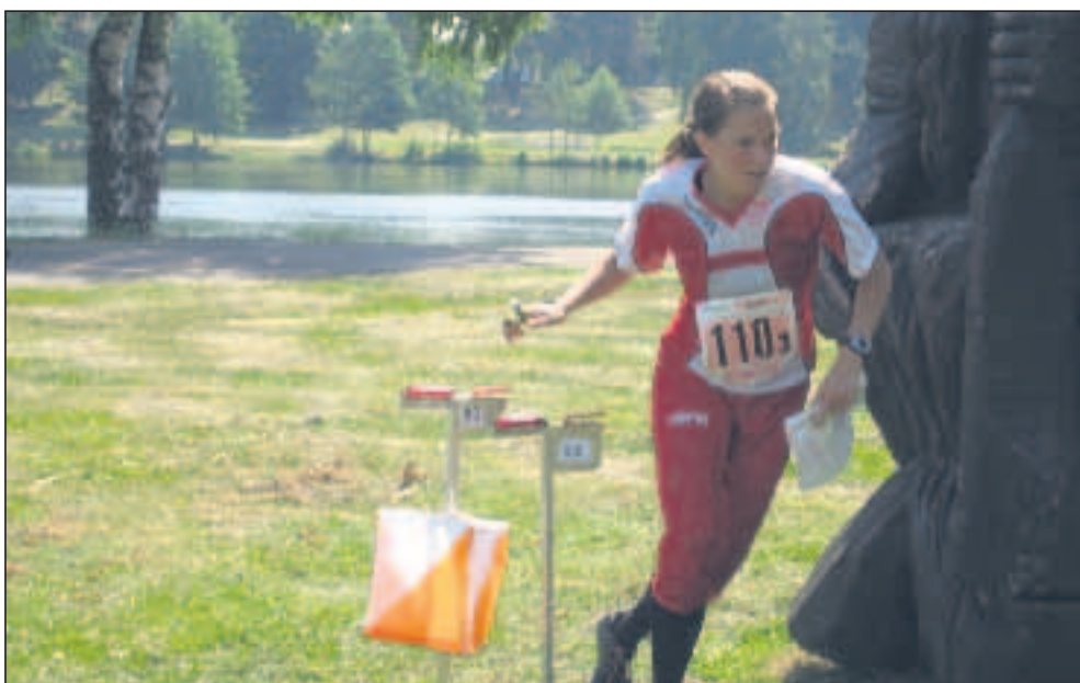
Ane ved publikumsposten. TBH