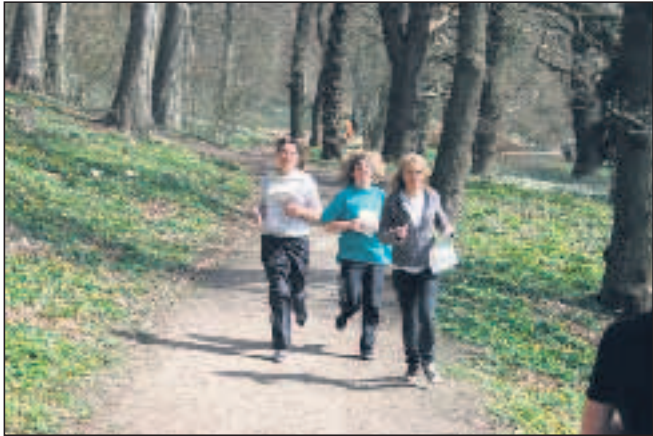
Krabbesholm er som bynær skov ideel til rekruttering.