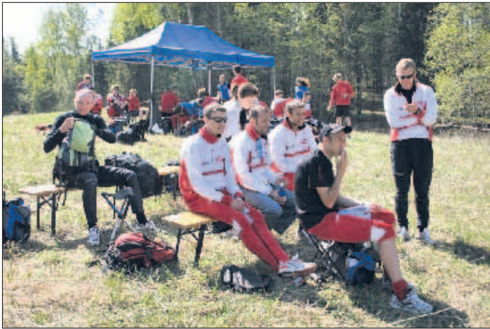
Holdene forbereder sig på vidt forskellig måde - men danskerne formår altid at hygge! KK.

Løberne forbereder sig på mange forskellige måder til opgaven. Det ukrainske hold har slået sig ned i et par havestole under et træ. Schweizerne sidder næsten helt nede ved søen og har indrammet deres »lejr« med små papirflag. Danskerne