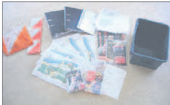
Skolekassen indeholder diverse hjælpemidler, bøger, hæfter, kort over de faste poster m.m. Materialets formål er at lette idrætslærers opgave under forberedelse og afvikling af orientering i Krabbesholm Skov. Skolen betaler 400 kr.

drene står og venter på at få deres børn med hjem igen.