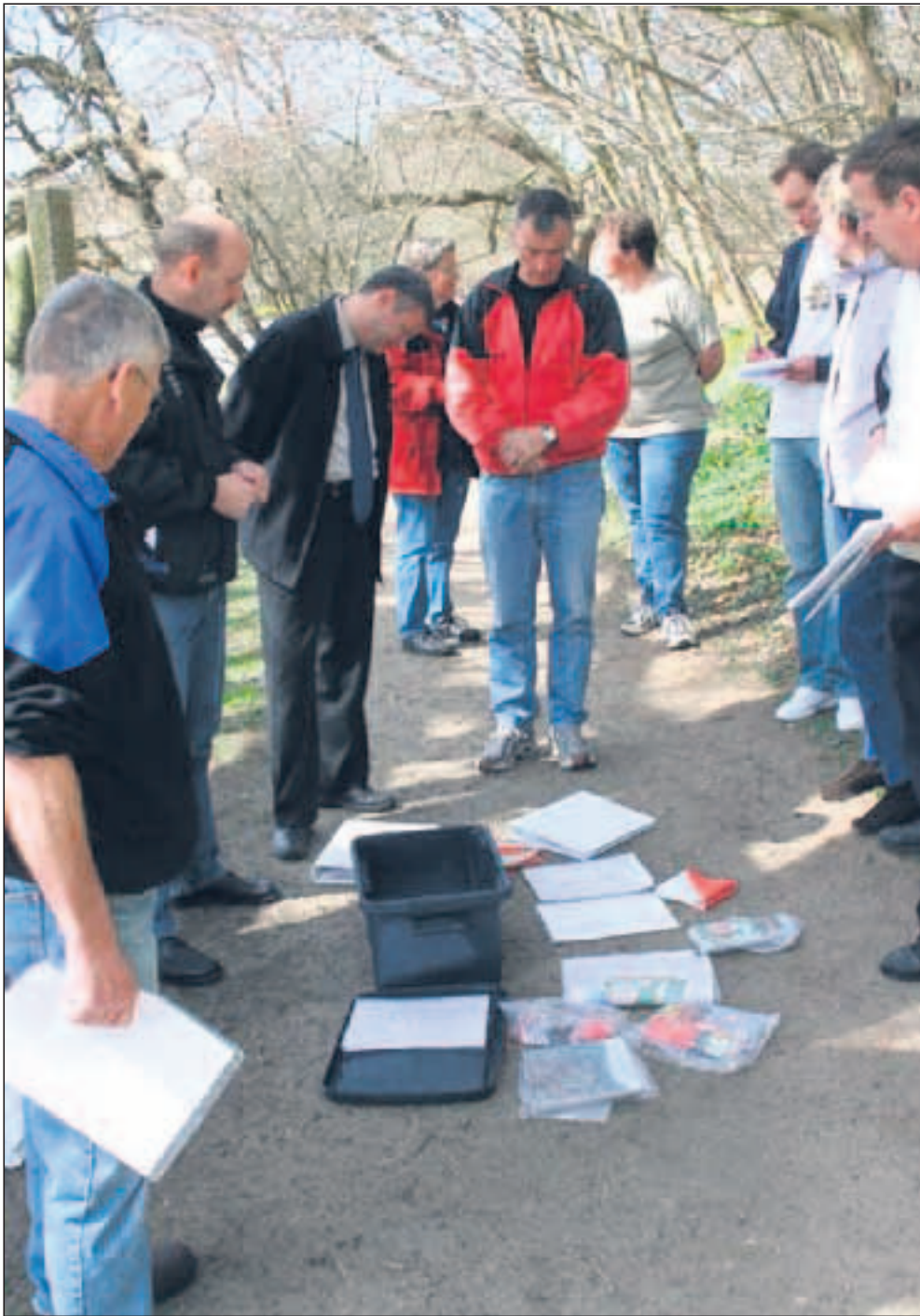
Ud fra de faste poster bliver der lavet fast lørdags orientering. Hertil er der udarbejdet en pakkelsejning over 4 lørdage, med 3 baner pr. lørdag