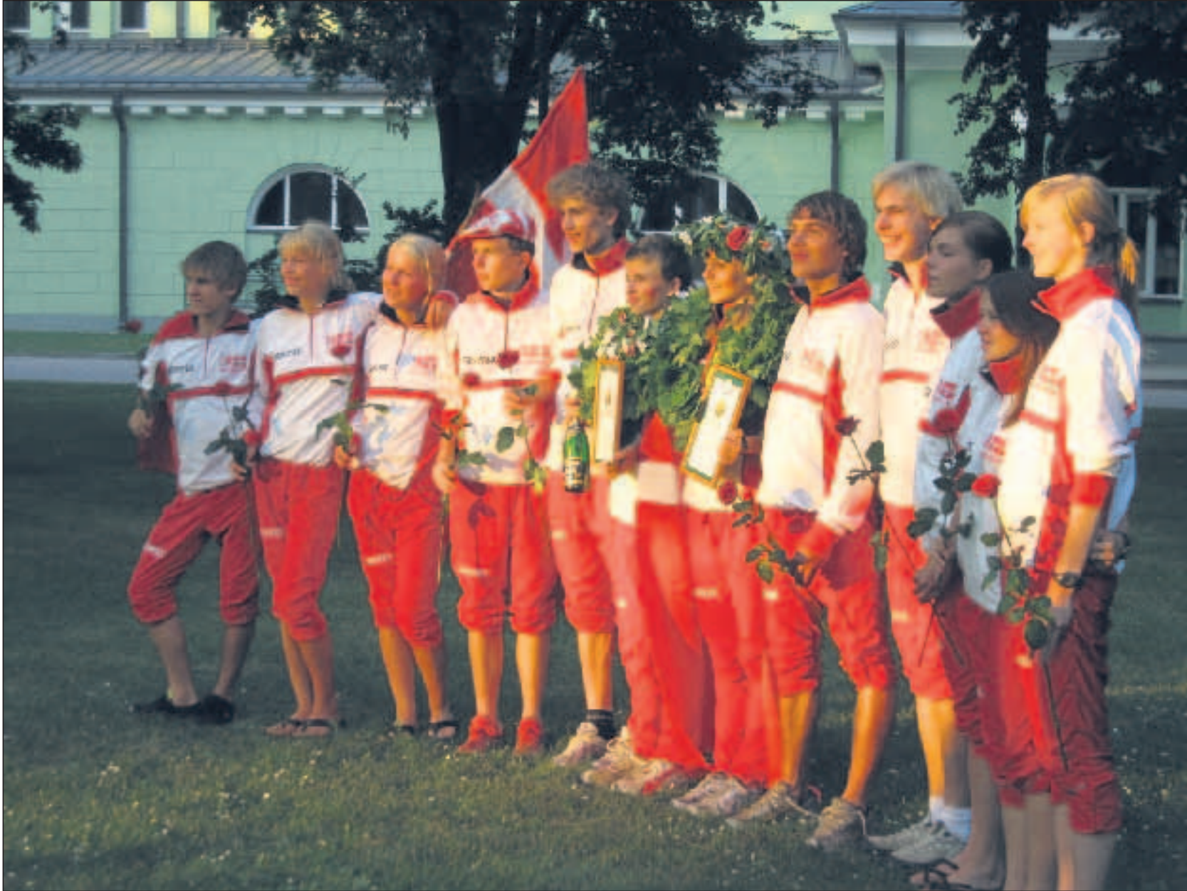
Hele juniorholdet, der gjorde det så fremragende. TBH