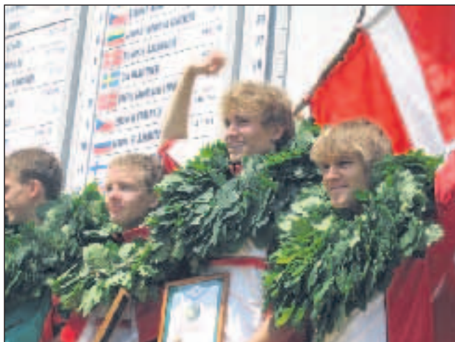
Drengene på podiet. TBH.