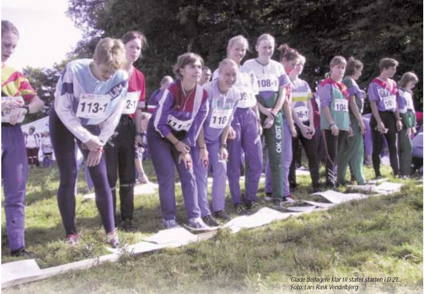
Glade deltagere klar til stafet starten i D 21.