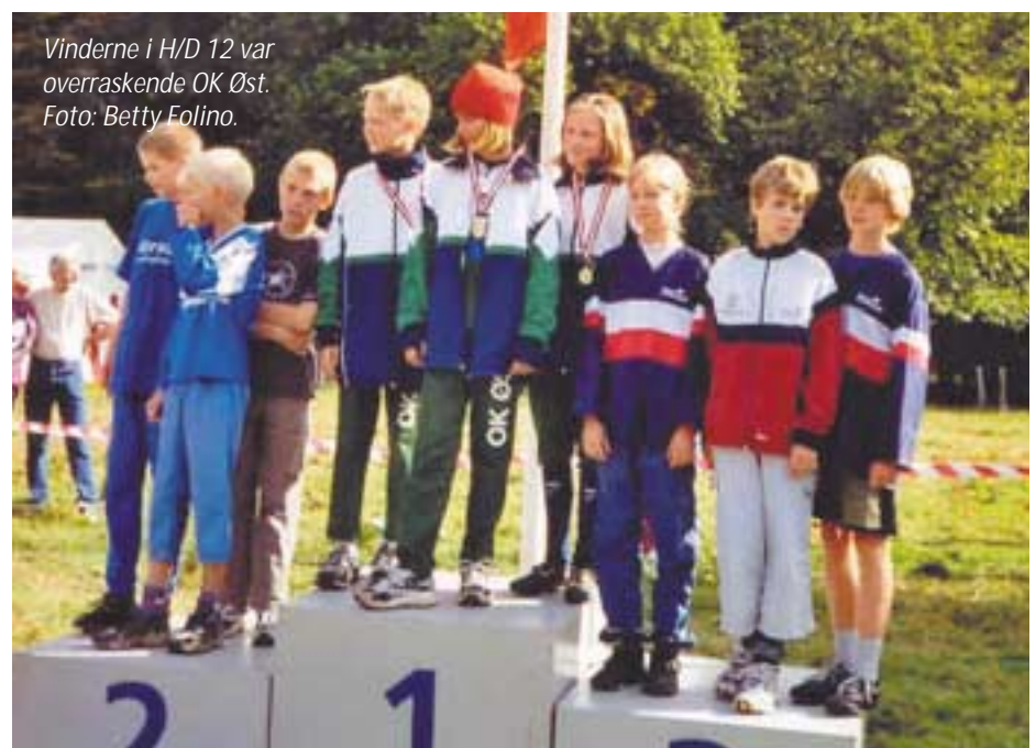
Vinderne i H/D 12 var overraskende OK Øst.

hvis de fik lov at løbe sammen to og to og snakke og hygge undervejs. Marius har løbet stort set hele sit liv (hans forældre er begge tidligere landsholdsløbere), og Anne og Helena startede med at løbe Børnekarruseløb for 6 år siden og på den måde kom ind i O-sporten. Vi glæder os til at se nye, store resultater fra talenterne fra OK Øst.