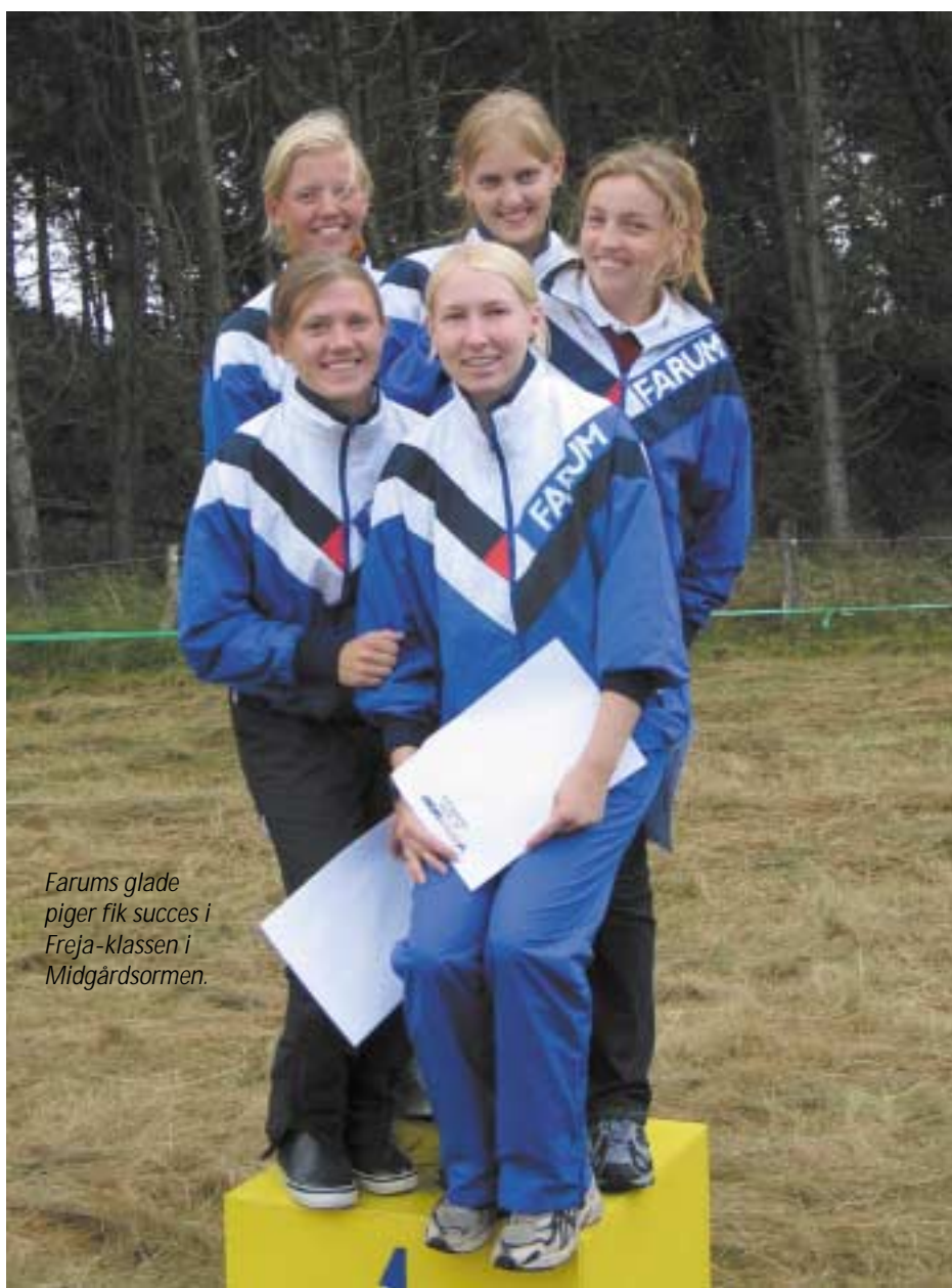
Farums glade piger fik succes i Freja-klassen i Midgårdsormen.