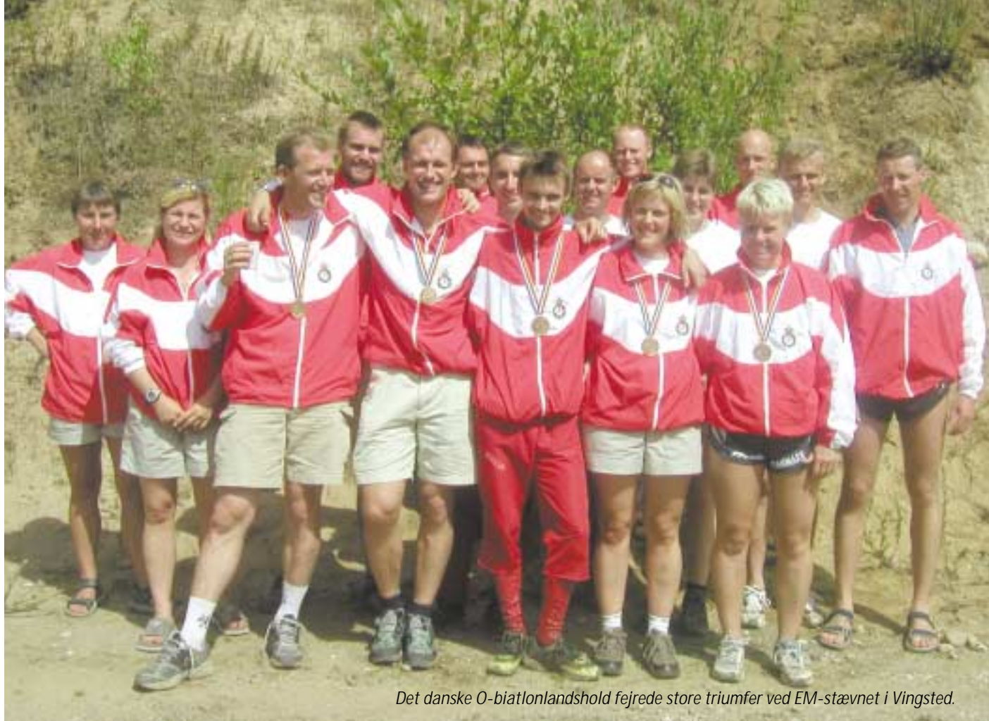
Det danske O-biatlonlandshold fejrede store triumfer ved EM-stævnet i Vingsted.