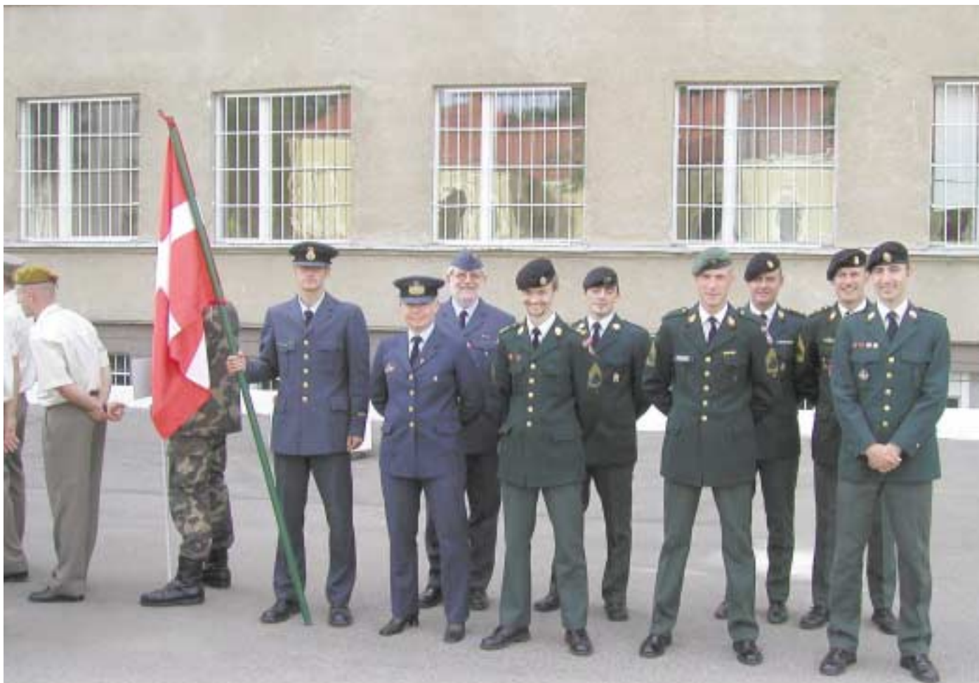
Den danske delegation - i stiveste militært outfit.